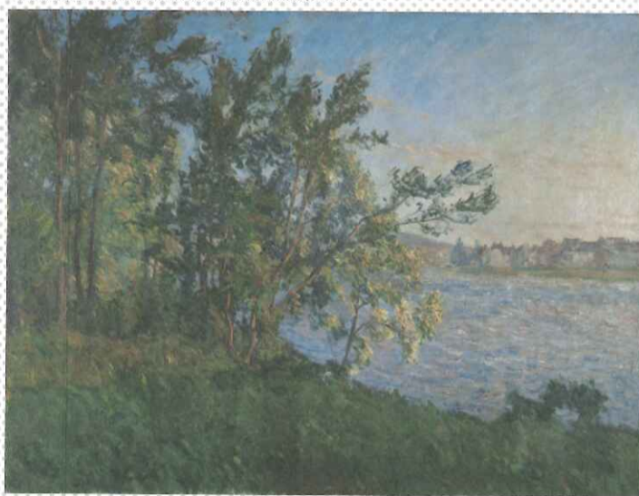
クロード・モネ《ヴェトウユの河岸からの眺め、ラヴァクール（夕暮れの効果）》1880年頃 個人蔵