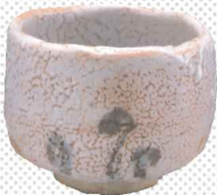
荒川豊蔵《志野茶碗 銘早春》 1978-1979年

—アートってなに？— アートってなんだろう。むずかしいのかな。美術館でみる作品ってなんだろう。みかたってあるのかな。 たってみる。すわってみる。ねころんでみる？ よんでみる。きいてみる。かいてみる？ いろんな「みる」をためてみたら、わたしのみたことおはなしてもいい？ アートとはどのようなものなのか。多様化する現代社会において、新たな可能性と役割を求められつつあるアートの最前線を鑑賞する。さまざまな「みる」人が求める作品とはどのようなものなのか、いろいろな「ナンヤローネ」を試してみる。ありそうでこれまでになかった展覧会。