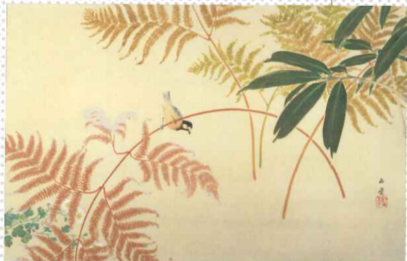
川合玉堂《野末の秋》1927年