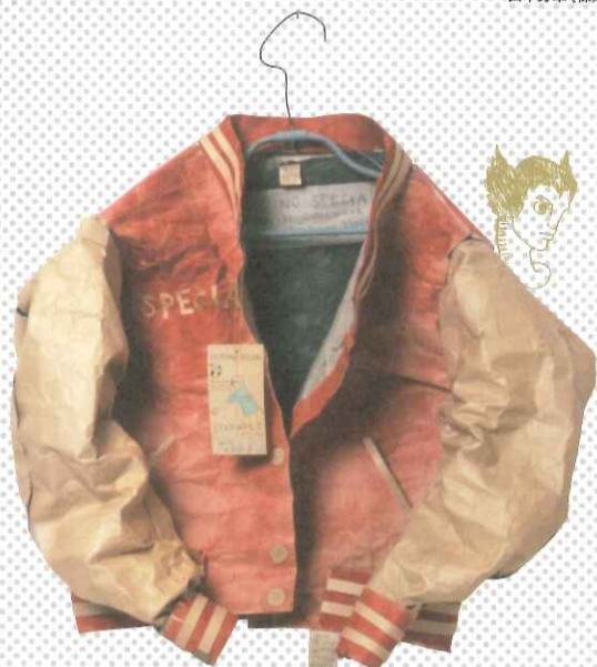
日比野克彦《SWEATY JACKET》 1982年