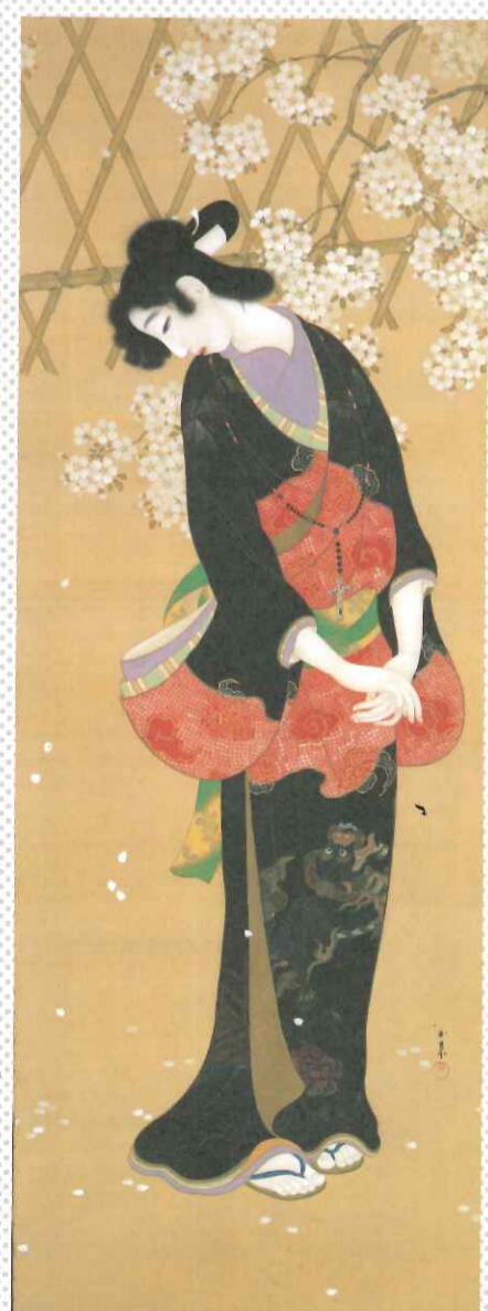
栗原玉葉《朝妻桜》1918年 個人蔵

観覧料 一般800円(700円)、大学生600円(500円) ( )内は20名以上の団体料金