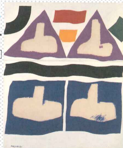
村井正誠《君ならぶ人々》1969年