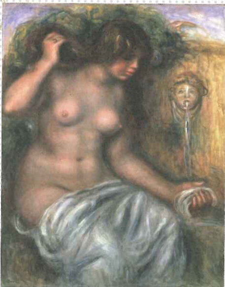
ピエール＝オーギュスト・ルノワール《泉》1910年