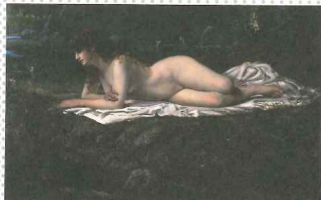
山本芳翠《裸婦》1880年頃